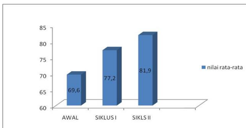
Gambar 1. Rata-Rata Prestasi Belajar Siswa pada Kondisi Awal, Siklus I, dan Siklus II