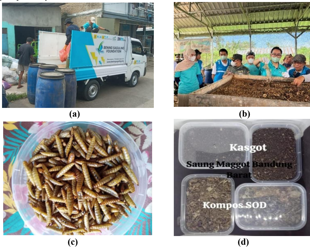
Gambar 2. Dokumentasi Kegiatan Program Saguling Berdaya. Proses Pengangkutan Sampah Rumah Tangga dengan Kendaraan Operasional PLN (a), Pengolahan Sampah Organik Sebagai Pakan Bagi Maggot (b), Budidaya Maggot (c), Kasgot dan Kompos (d) Hasil Budidaya Maggot

telah memanfaatkan sampah organik untuk pakan maggot dan selanjutnya maggot diolah menjadi pakan ayam.