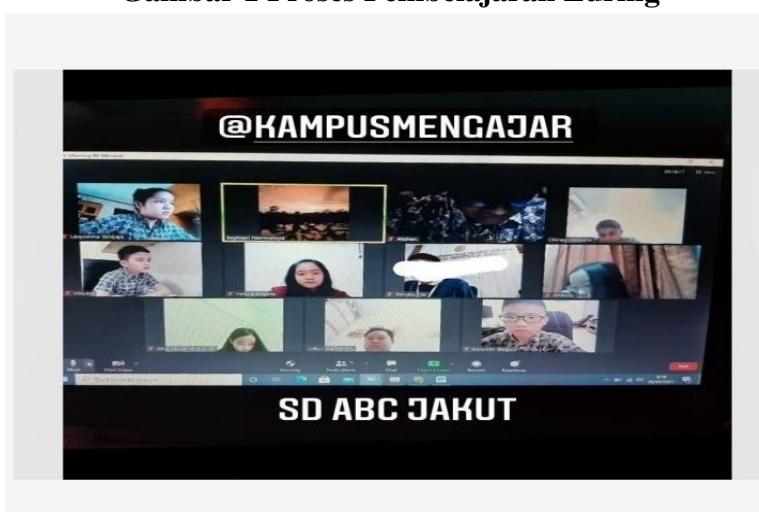
Gambar 2 Proses Pembelajaran Daring

Pelaksanaan adaptasi teknologi di SDS ABC yaitu mulai dari membantu dalam penggunaan video conference seperti Zoom maupun Gmeet dalam proses kegiatan maupun dalam pembelajaran hingga pengawasan ujian siswa. Membantu guru dalam memberikan