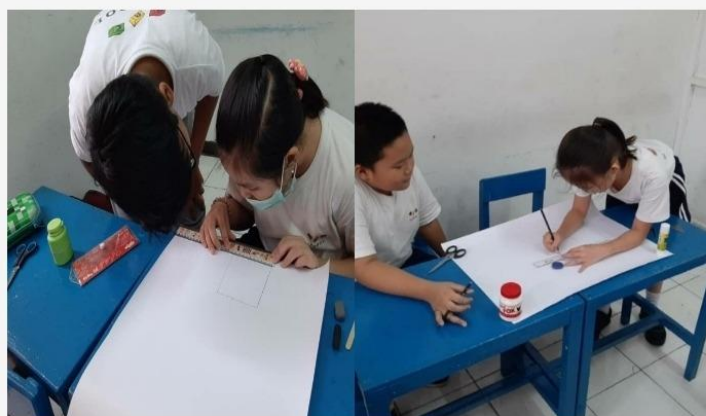
Gambar 1 Proses Pembelajaran Luring

Kami dalam proses pembelajaran membantu berbagai mata pelajaran seperti matematika bagian menghitung pertambahan, perkalian, penjumlahan, pengurangan, dan berbagai materi menghitung lainnya, tentang susunan kalimat yang tepat, penggunaan huruf kapital, dan berbagai materi membaca dan memahami. Kami juga memberikan materi kebangsaan seperti pancasila. Siswa diajarkan mengenai makna dari sila pancasila, sehingga siswa dapat memahami makna dari masing-masing sila dan mengimplementasikannya.